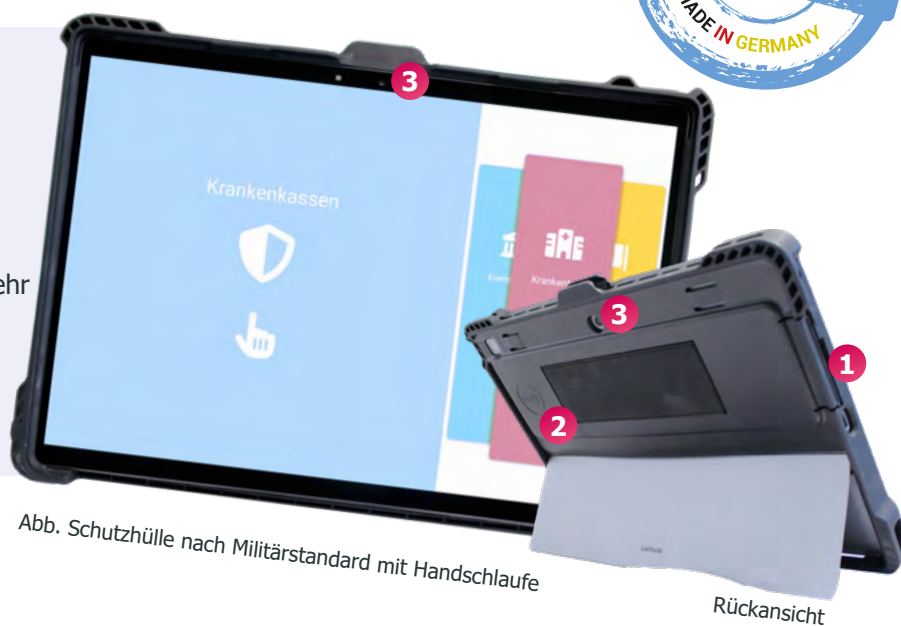
Abb. Schutzhülle nach Militärstandard mit Handschlaufe